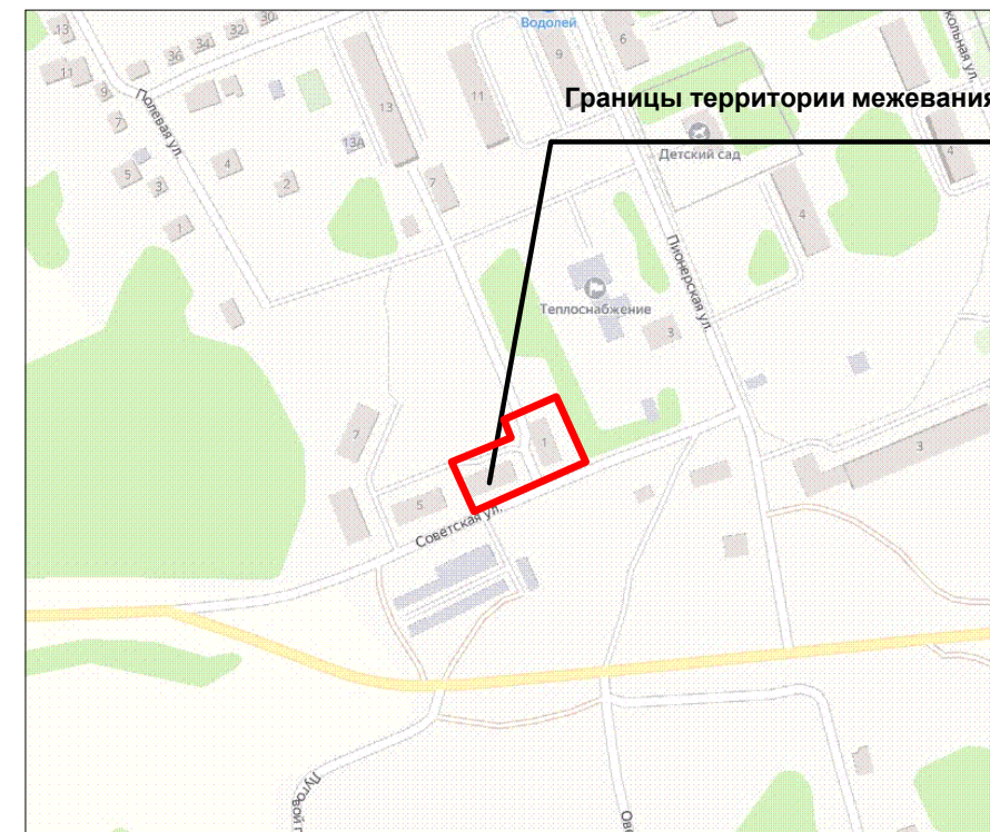
Местоположение территории межевания в структуре населенного пункта